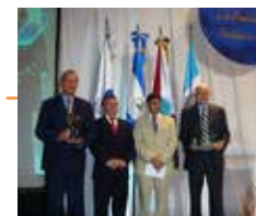
Algunos de los ganadores en la 3ª. Edición: Gobierno de la República de Corea y Shell Guatemala, S.A.